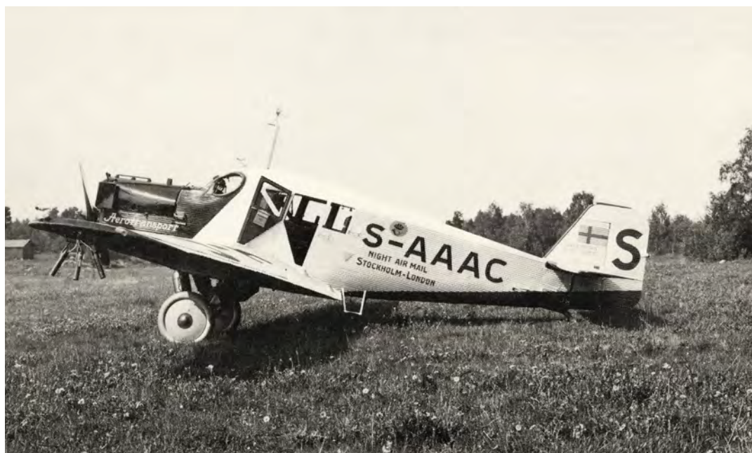
Aktiebolaget Aerotransports äldsta S-AAAC flygplan, Junkers F13 som inköpts 1924, blev världens första bemannade flygplan med postsorteringskupé.

Med anledning av att Barkarby flygfält just firat 100 år visar jag här några objekt ur min filatelistiska Hembygdssamling. De har alla fyra varit med på de tidigaste flygningarna med post från eller till Barkarby 1928-1929. Samlingen har jag kallat ”Kommunikationer och deras nyttjande inom Järfälla kommun.”